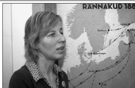
Kirjaniku rännakute pajatas Vilde maja giid

Ligi 20 aastat oma elust kulutas Eduard Vilde reisimisele. Elu lõpuperioodil Vilde enam uusi teoseid ei kirjutanud, vaid tegeles kogutud teoste koondamisega, kokku kogunes neid 33 köidet ligi 8000 leheküljega. Seda saavutus pole suutnud ületada ükski teine Eesti kirjanik. Kriitilise realismi algatajana olid tema teosed väga populaarsed, eluline sisu ja fantaasiaküllased mõttekäigud andsid tema töödele erilise sära.